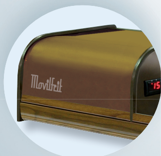
Madera / Madeira / Wood