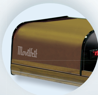
Nogal / Nogueira / Walnut