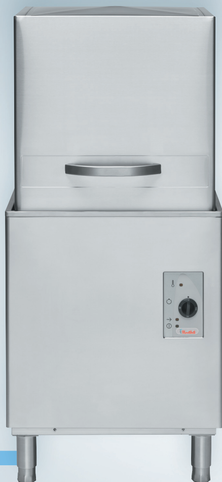
MLC80 / MLC120