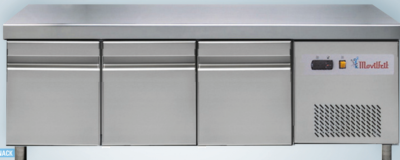
MGL 1800 SNACK