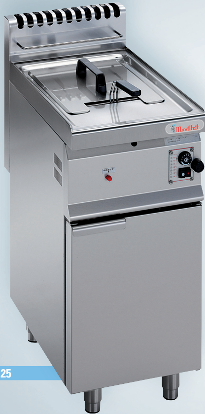
FG16 / FG25