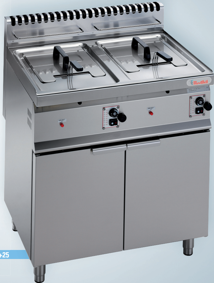
FG16+16 / FG25+25