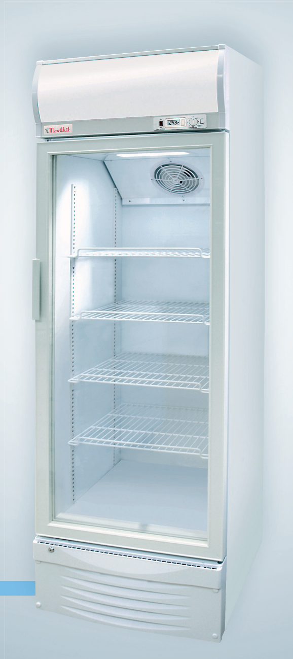
ARL 1033 CA