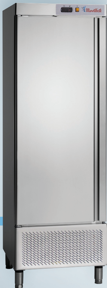
ARL 1000 C