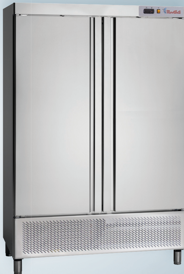
ARL 2000 C